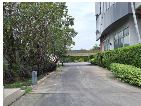
รูปที่ 1.7.6-1 สภาพปัจจุบันของโครงการ